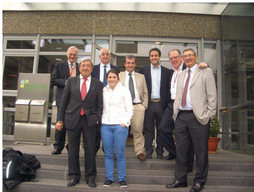
La delegación de BKA con el Presiente Javier Iguíñiz

Un punto, viejo y nuevo, fue la alarmante situación de nuestras cuentas. Una constatación clara y no coyuntural: las agencias católicas han cortado o reducido drásticamente su colaboración con Pax Romana y grupos similares. Consideran que un movimiento de profesionales debe tener capacidad de autofinanciamiento en un porcentaje mucho más alto del actual.